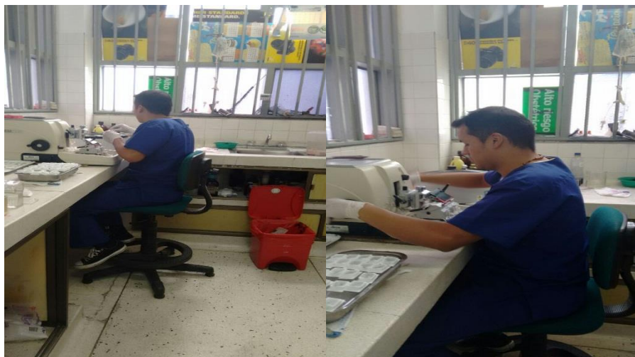
Figura 1. Área de patología.

Precisamente y basados en la normativa que demanda y establece una forma de realizar investigación a nivel académico profesional, el diagnóstico de los peligros y la evaluación de los riesgos que se plantea sobre la seguridad y salud de los trabajadores de la unidad de patología del Hospital Hernando Moncaleano Perdomo de la ciudad Neiva, está revestida del apoyo en el diseño de la matriz de riesgos, que favorecen el entendimiento y el sustento al quehacer diario de la actividad en esa unidad, así como el apoyo a la labor desarrollada en el campo de la salud, con el fin de mejorar técnicas de detección de esta clase de peligros, que pueden desatarse en enfermedades para la población de estudio. Por esta razón la orientación del presente artículo se fortaleció altamente con las investigaciones que sobre el tema se alcanzaron en el estudio emprendido y que contribuyen en el buen desempeño profesional y surjan retos al generar espacios de acción por la labor realizada en el campo de trabajo de la fisioterapia.