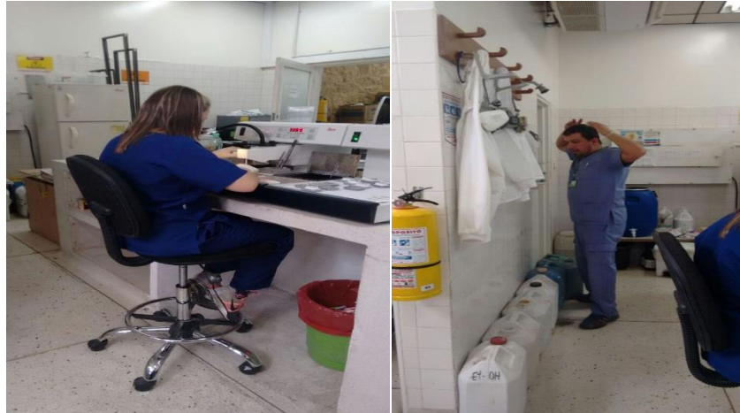
Figura 3. Condiciones de trabajo

protección, sin costo alguno y debería aplicar medidas destinadas a asegurar que se utiliza y se conserva dicho equipo 7 .