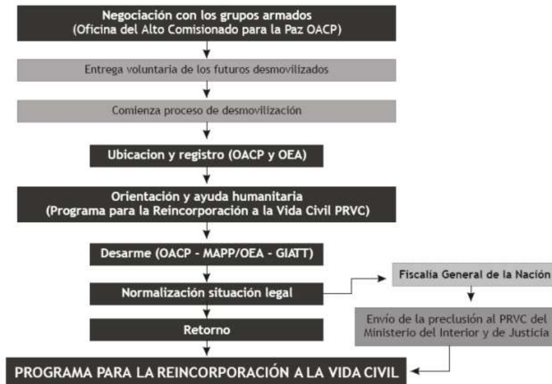
Figura 2. Negociación con los grupos armados