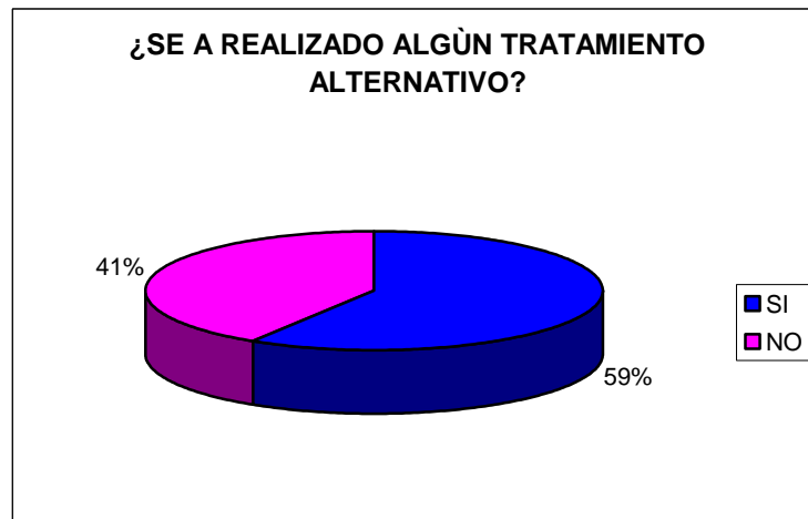
GRAFICA N° 1. utilización de las terapias alternativas como método de tratamiento en las personas encuestadas.

Solo el 10 % de la población encuestada conoce la moxibustión como una terapia alternativa