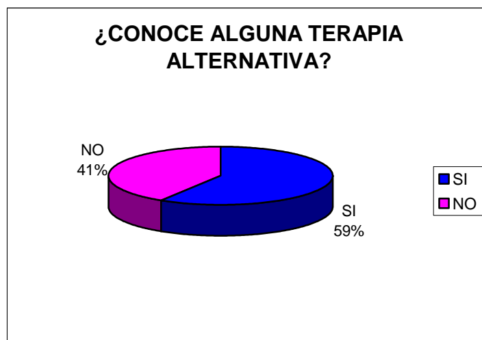
GRAFICA N° 1. Conocimiento sobre la existencia de las terapias alternativas en las personas encuestadas.

El 59% de la población encuestada conoce algún tipo de terapia alternativa y se a realizado algún tipo de tratamiento con estas. (graficas 1 y 2)