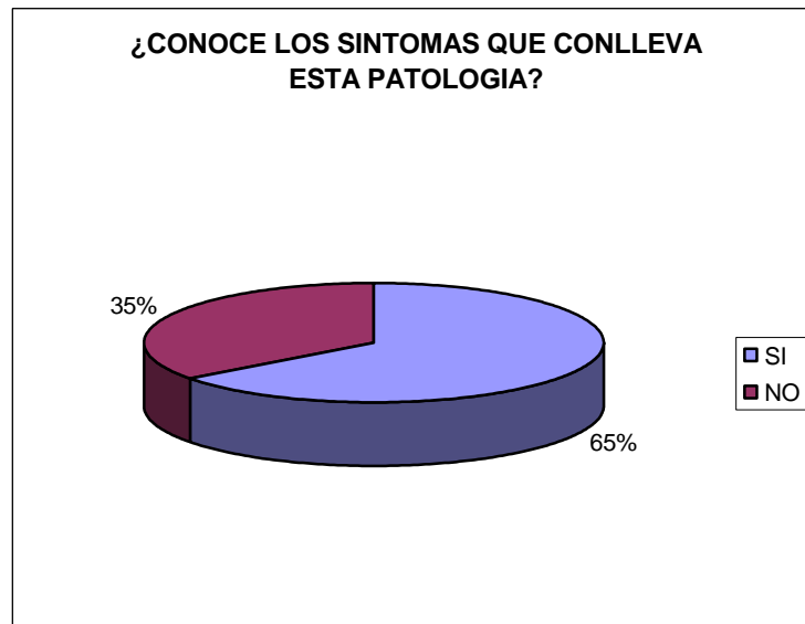
GRAFICA N° 4. Conocimiento sobre los síntomas que conlleva la artritis reumatoidea